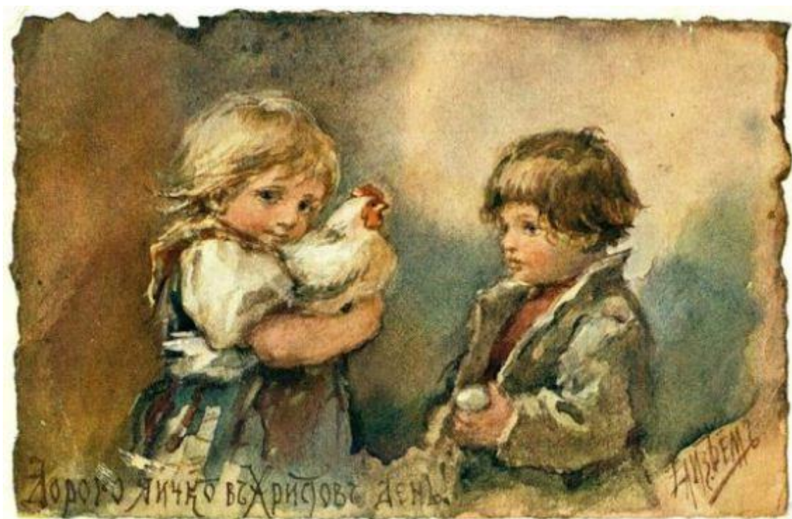
Открытка на Пасху

После Октябрьской революции в нашей стране было запрещено производство открыток с рождественской и новогодней символикой, а также с изображением религиозных символов и народных праздников. Новая власть считала подобные образцы печатной продукции буржуазным пережитком.