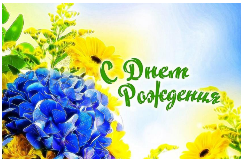
Современная печатная открытка

На сегодняшний день в продаже представлен огромный ассортимент открыток различной тематики, разных размеров и форматов, со стихами, шутливыми текстами, рисунками — комиксами и музыкальными вкладышами.