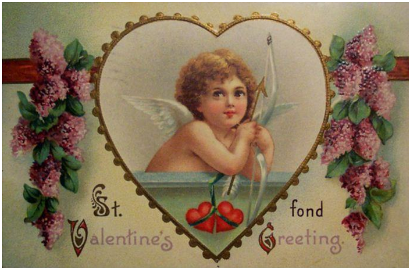
Старинная открытка на День Святого Валентина

Одно из первых упоминаний о поздравительных открытках относится к 1777 году, когда «Пражский почтовый альманах» разместил на своих страницах сообщение о том, что «по почте пересылаются как приветствия и поздравления на самые различные случаи гравированные карточки, часто с текстом; они пересылаются открытыми для всякого». В данном источнике автором изобретения открыток называют гравера Демезона.