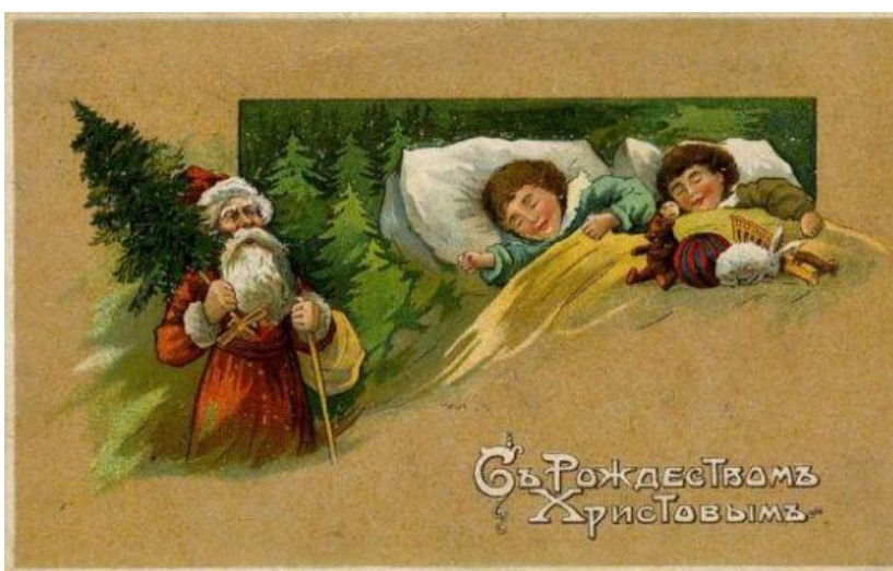
Старинная открытка «С Рождеством Христовым!»

Художник послал эту самодельную карточку своему другу, которому та чрезвычайно понравилась. В 1795 году Добсон напечатал несколько десятков таких рождественских открыток и разослал всем своим знакомым.